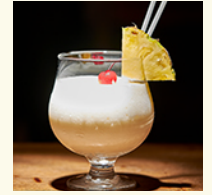
Pina Colada ¥1,200