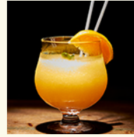
Frozen mango daiquiri ¥1,200