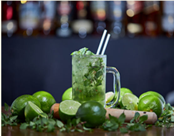
Original Mojito ¥1,000