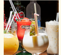
Ali Jiru ¥1,000