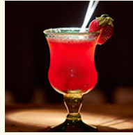
Frozen strawberry Margarita ¥1,200