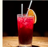
Sangria Special ¥1,000